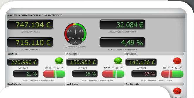
Analisi rete di vendita: fatturato corrente vs precedente